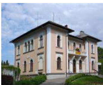
Za vírou Doris 'víř, který se nikdy nenapí'